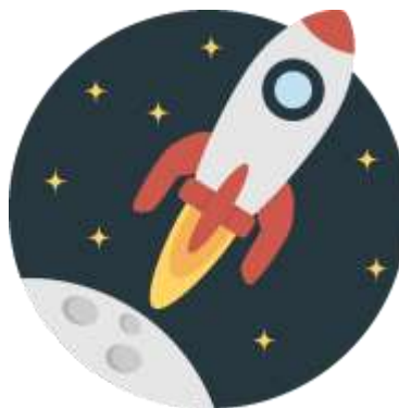
Продвижение и управление изменениями