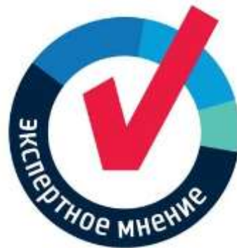
Опрос экспертов по теме